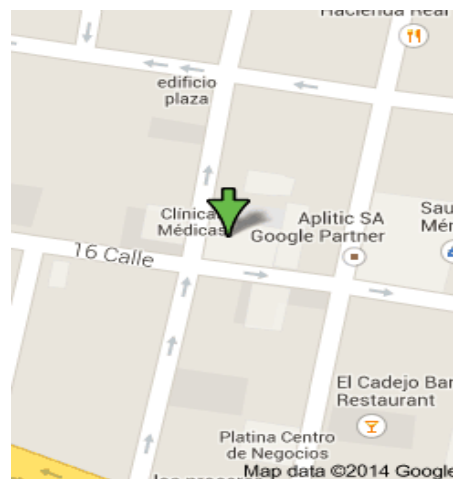
Figura No.1: Mapa de ubicación de la Clínica Médica Urquizú.

La empresa individual se encuentra debidamente inscrita en la Superintendencia de Administración Tributaria con el NIT no. 472251-5, presta servicios dermatológicos desde hace más de 20 años y ha ampliado sus servicios cosméticos desde hace 5 años.