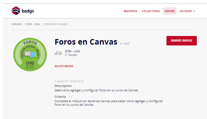
Fig. 2. Vista de pantalla de los componentes que definen una insignia digital dentro de la plataforma Badgr.

Cada insignia debe contar con un nombre claro y concreto que haga referencia a la competencia desarrollada. Es recomendable también diseñar un logotipo o emblema que sea visualmente atractivo y simbolice el logro alcanzado. También es requerido agregar una descripción breve y los criterios que se evaluarán para obtener la insignia. El proceso de creación de insignias puede ser tardado si no se tiene claro dentro del diseño instruccional del curso, el conjunto de actividades que le permitirán al estudiante ganar sus insignias. Es por ello, que la estructuración del curso con sus diferentes secuencias de aprendizaje es fundamental para facilitar la definición e incorporación de insignias digitales. Dado que el curso Aprende Canvas tiene como fin desarrollar en los docentes las destrezas básicas para el uso del sistema de gestión de aprendizaje de la universidad, se hizo una priorización de las funcionalidades del mismo y fue así como se estableció que se otorgarían las siguientes insignias dentro del curso: Calendario, Mensajería y Notificaciones en Canvas; Editor de Contenido en Canvas; Página de inicio y Programa de Iniciativa Académica en Canvas; Menú principal en Canvas; Configuración de tareas y calificaciones en Canvas; Foros en Canvas; Utilizar el libro de calificaciones en Canvas; Configurar Módulos en Canvas; y Aprende Canvas Nivel 1 que es la evaluación final.