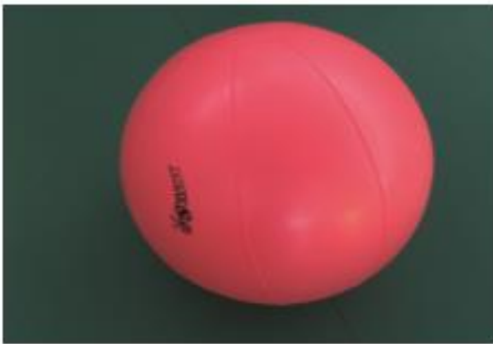
Figura 8. Pelota que se utilizará en el Trastorno del Espectro Autista y Bienestar Físico. Fuente: Ángel Vega y Martínez Rodríguez. (2007, p.61)