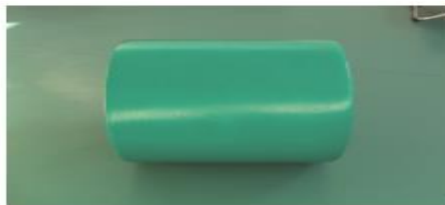
Figura 6. Rollo terapéutico para tratar el Trastorno del Espectro Autista y Bienestar Físico. Fuente: Ángel Vega y Martínez Rodríguez. (2007, p.60)