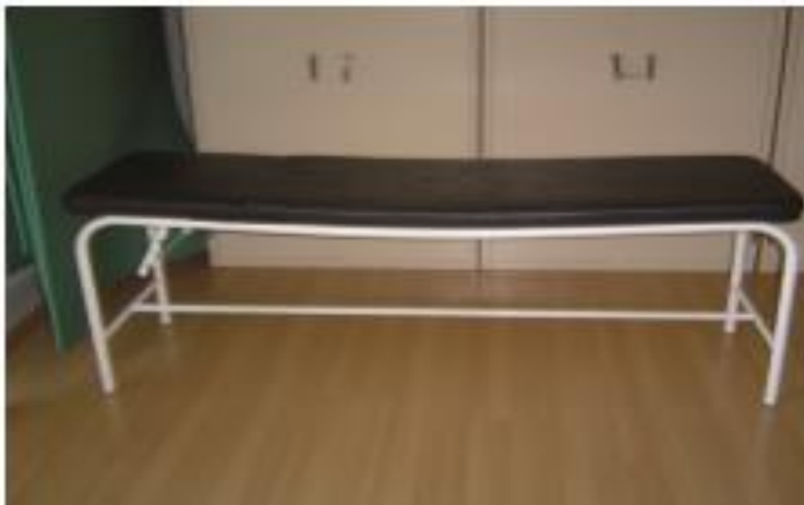
Figura 3. Camilla para tratar el Trastorno del Espectro Autista y Bienestar Físico. Fuente: Ángel Vega y Martínez Rodríguez. (2007, p.59)