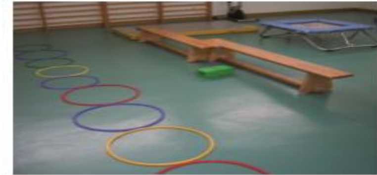
Figura 2. Material para realizar la terapia del Trastorno del Espectro Autista y Bienestar Físico. Fuente: Ángel Vega y Martínez Rodríguez. (2007, p.59)

Anexo No. 1: Recursos empleados en el abordaje fisioterapéutico.