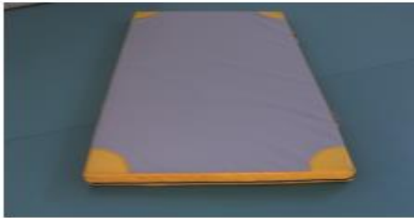
Figura 5. Colchoneta para la terapia en el Trastorno del Espectro Autista y Bienestar Físico.