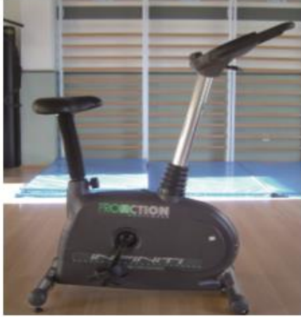
Figura 7. Bicicleta estática para la terapia del Trastorno del Espectro Autista y Bienestar Físico.