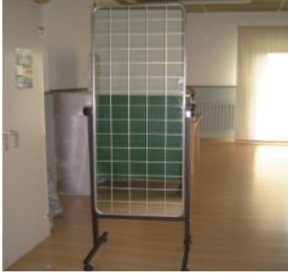
Figura 4. Espejo para tratar el Trastorno del Espectro Autista y Bienestar Físico. Fuente: Ángel Vega y Martínez Rodríguez. (2007, p.60)